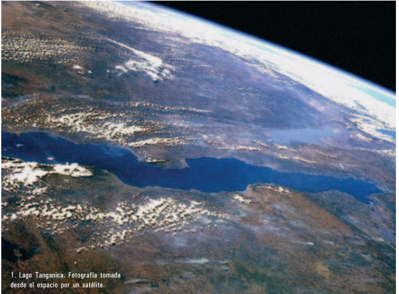
1. Lago Tanganica. Fotografía tomada desde el espacio por un satélite.