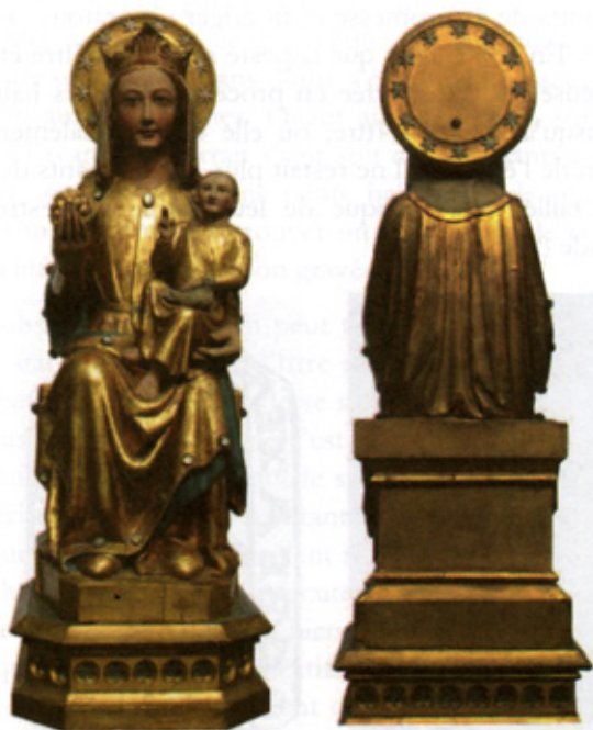
Illustrations 1 et 2

La statue miraculeuse de Notre-Dame, vénérée aujourd'hui encore à Ittre (ill. 1-2), n'a pas toujours occupé la place d'honneur dans l'église de cette paroisse 1 . En effet, à l'origine la statue fut réalisée pour la chapelle de Bois-Seigneur-Isaac où les fidèles l'adoraient sous le vocable de « Notre-Dame de Grâce et de