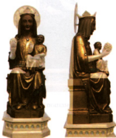
Illustrations 12 et 13

velles réalisée entre 1272 et 1298 27 . Comme l'avait noté Joseph DE BORCHGRAVE D'ALTENA, la Sedes d'Ittre présente aussi un certain nombre de caractéristiques communes avec la statue de Notre-Dame de Laeken (ca 1230-1250) et celle de Diest (ca 1230-1250), toutes deux aussi très restaurées, ou encore avec celle dite « Notre-Dame de la Vignette » à Huy (ca 1250-1260) 28 . Cependant, à la différence de ces œuvres, la Sedes d'Ittre ne foule pas le dragon de ses pieds, ce qui ne constitue pas nécessairement un critère en faveur d'une datation plus tardive. Au cours de la seconde moitié du XIII e siècle, l'évolution du type iconographique de la Sedes se marque dans une humanisation de la Vierge et de son Enfant. Les visages deviennent plus souriants, comme dans le groupe de la châsse de Stavelot (ca 1263-1268) ou dans la Vierge de la Trésorerie de Walcourt (1250-1260) et un rapport de tendresse s'établit même quelquefois entre la mère et son enfant. Une fois encore, les transformations de la Sedes d'Ittre dues à la restauration nous empêchent de pousser les comparaisons. Finalement, c'est principalement la présence du voile court qui nous permet de proposer pour l'œuvre étudiée ici une datation dans le troisième quart du XIII e siècle 29 .