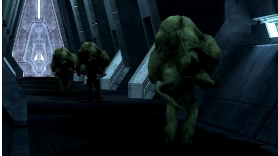
Figure 5 - Plan du machinima « The Lives Of - The Flood » servant de support à la description de ces créatures

Néanmoins, le matériel qui est ainsi détourné comporte une spécificité par rapport aux vidéos abordées précédemment : la majorité des actions montrées n'ont pas été performées par le joueur-créateur (comme c'était le cas dans le montage et dans la série Red Vs. Blue ), mais sont, en vérité, des événements originellement présents dans le jeu que l'auteur a enregistrés, commentés et montés (certains extraits de la vidéo sont même issus de cinématiques de Halo , donc de passages non interactifs). En d'autres termes, l'œuvre produite ne témoigne pas (ou très peu) d'une performance ludique (d'un play ), mais plutôt de la manipulation et de la reconfiguration d'une série d'éléments constitutifs du jeu original (du game ) : dans « The Lives Of - The Flood », chaque situation ou chaque objet extrait du jeu vient servir de prétexte au développement d'un micro-récit (généralement ironique).