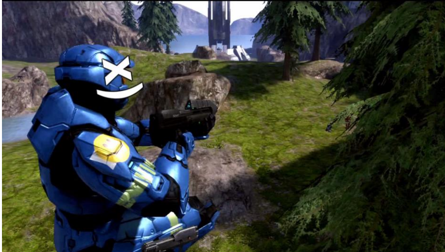
Figure 2 - Les plans du montage « Eternity Pro Gaming - Halo 3 Montage » peuvent échapper à la vue à la première personne et les images peuvent se voir adjoindre du texte

En d'autres termes, dans ce type de vidéo, le gameplay propre au jeu n'est pas conservé ou traduit mais mis en scène, esthétisé : le « détournement » à l'œuvre ici (le réemploi de séquences de jeu dans un autre contexte de lecture) n'a donc pas pour fonction de subvertir le sens de l'œuvre originale, mais plutôt d'en constituer un prolongement et une sauvegarde (les montages viennent archiver les « beaux gestes » de joueurs). L'on retrouve ici la conception du machinima défendue par Henry Lowood (2011), qui conçoit ces vidéos comme un puissant outil de documentation sur les pratiques ludiques :