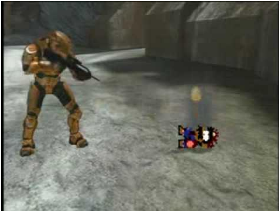
Figure 11 - Le machinima « Mario Vs Spartan »

musique populaire, à l'instar du clip musical « Spartan Style » de la TeamHeadKick 30 , qui parodie la célèbre chanson Gangnam Style du chanteur sud-coréen Psy.