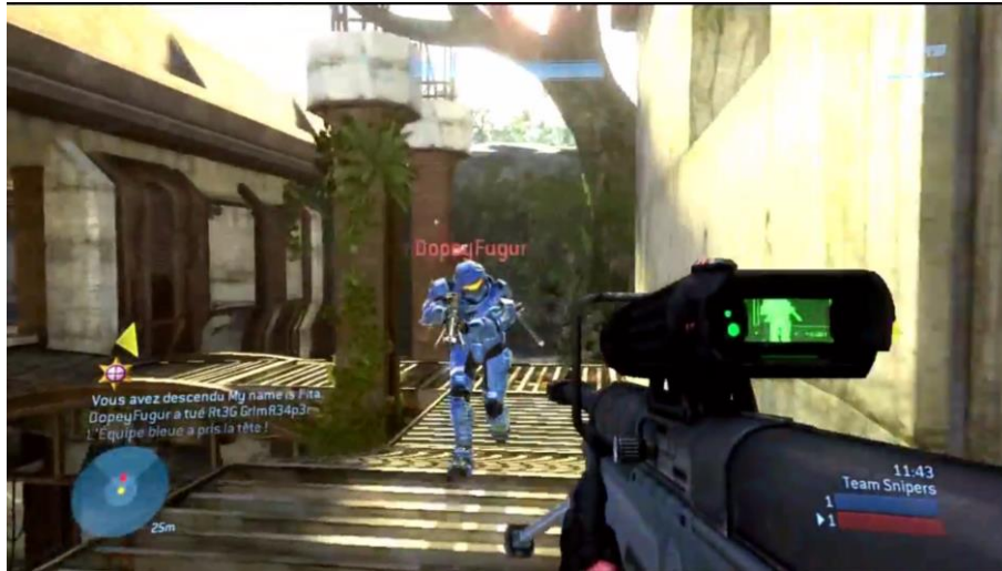
Figure 1 - Capture d'écran du montage « Eternity Pro Gaming - Halo 3 Montage »

personnages, interface...) et les actions accomplies par les joueurs conservent donc, dans le machinima , le même sens que celui qu'ils exprimaient au sein du jeu. Cette utilisation correspond à ce que Bardzell (2011 : 206) nomme un « style objectif » (par opposition à un « style subjectif », sur lequel nous reviendrons) : le machinima fonctionne comme une représentation du jeu.