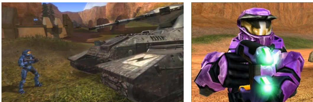
Figure 3 – Dans Red Vs. Blue , les éléments originaux du jeu et les gestes ludiques sont considérablement resémantisés

Pour illustrer la portée critique de cette resémantisation de la pratique vidéoludique, attardons-nous sur un extrait du deuxième épisode de la série 19 , dans lequel l'équipe des rouges reçoit un nouveau véhicule de combat portant le nom de « Warthog ». Dès l'arrivée du véhicule (01:09) 20 et durant tout le reste de l'épisode, celui-ci ne sera pas utilisé par les protagonistes mais deviendra l'objet de tous les regards. La mise en scène du Warthog y est très cinématographique : la « caméra » (qui, notons-le, est performée par un joueur) zoome sur ses attributs et tourne autour de l'engin pour le mettre en valeur comme s'il s'agissait d'une publicité (01:22). La fonction initiale du véhicule, à savoir le combat, passe ici à la trappe au profit d'une interminable discussion sur le choix de son nom. Or cette tergiversation fonctionne comme une totale négation de l'action, donc comme une subversion de la dimension militaire qui est pourtant centrale dans les jeux Halo . L'humour de l'épisode est presque intégralement construit sur ce simple transfert d'un élément depuis un contexte ludique où règne le combat vers un support non interactif (la vidéo), statique, et qui ne cesse de mettre en scène sa staticité (dans cet épisode comme dans bien d'autres, il ne se passe presque rien). Le dispositif produit ce que Genette (1982 : 532) décrit comme un « comique hypertextuel », à savoir un comique provenant essentiellement du fait que le machinima est subordonné à un hypotexte.