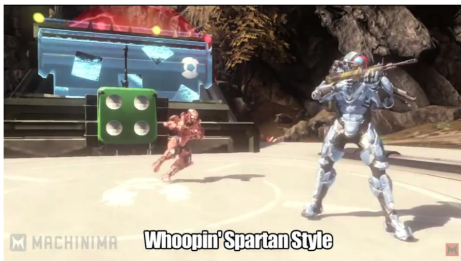
Figure 12 - Le clip musical « Spartan Style »

Au-delà même de ces inspirations multiples, le machinima est un procédé intrinsèquement hybride, transmédiatique, dans le sens où il emprunte formellement à des codes très divers : « machinima is an example of an art form that draws from a number of earlier traditions, such as cinematic storytelling, live performance, and puppeteering, and also makes use of new computer game and real-time 3D graphics technologies for the creation of narrative works » (Mazalek, 2002 : 94). Cette dimension transmédiatique complexifie encore l'appréhension du détournement de jeux vidéo, étant donné que le discours tenu par les œuvres au second degré ne porte pas uniquement sur le médium