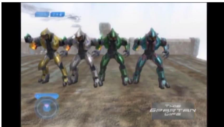
Figure 7 - Les « Solid Gold Elite Dancers » en pleine chorégraphie

Dans ce machinima , les ressorts du détournement sont donc tout à fait opposés à ceux de l'exemple précédent. En effet, le game du jeu original reste ici globalement inchangé : ses éléments constitutifs ne sont guère réagencés ou resémantisés, dans le sens où les environnements ludiques représentés dans les vidéos ainsi que les actions qui s'y déroulent renvoient à des événements qui sont vraiment advenus lors d'une partie effective. Ce n'est donc pas dans la modification de l'œuvre originale que réside le détournement, mais dans son usage : c'est par l'exercice d'un play singulier, d'une performance ne répondant pas aux objectifs du jeu que l'hypotexte gagne un nouveau sens. Cette refonte par la performance trouve différentes illustrations au sein des vidéos : l'attitude des intervenants et du présentateur (qui circulent en marchant paisiblement à travers les champs de bataille et qui discutent plutôt que de combattre), par exemple, contraste fortement avec les objectifs compétitifs d'un first-person shooter en ligne et avec l'action continue qui règne dans les environnements parcourus. Dans le même ordre d'idées, chaque épisode de l'émission This Spartan Life est divisé en plusieurs « modules » thématiques, parmi lesquels figure généralement un spectacle de « danse » où cinq avatars (les « Solid Gold Elite Dancers ») enchaînent différents mouvements de manière coordonnée.