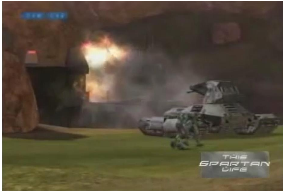
Figure 6 - Le présentateur et son invité discutant et marchant calmement alors que d'autres joueurs se livrent bataille en arrière-plan

Dans ce machinima , les ressorts du détournement sont donc tout à fait opposés à ceux de l'exemple précédent. En effet, le game du jeu original reste ici globalement inchangé : ses éléments constitutifs ne sont guère réagencés ou resémantisés, dans le sens où les environnements ludiques représentés dans les vidéos ainsi que les actions qui s'y déroulent renvoient à des événements qui sont vraiment advenus lors d'une partie effective. Ce n'est donc pas dans la modification de l'œuvre originale que réside le détournement, mais dans son usage : c'est par l'exercice d'un play singulier, d'une performance ne répondant pas aux objectifs du jeu que l'hypotexte gagne un nouveau sens. Cette refonte par la performance trouve différentes illustrations au sein des vidéos : l'attitude des intervenants et du présentateur (qui circulent en marchant paisiblement à travers les champs de bataille et qui discutent plutôt que de combattre), par exemple, contraste fortement avec les objectifs compétitifs d'un first-person shooter en ligne et avec l'action continue qui règne dans les environnements parcourus. Dans le même ordre d'idées, chaque épisode de l'émission This Spartan Life est divisé en plusieurs « modules » thématiques, parmi lesquels figure généralement un spectacle de « danse » où cinq avatars (les « Solid Gold Elite Dancers ») enchaînent différents mouvements de manière coordonnée.