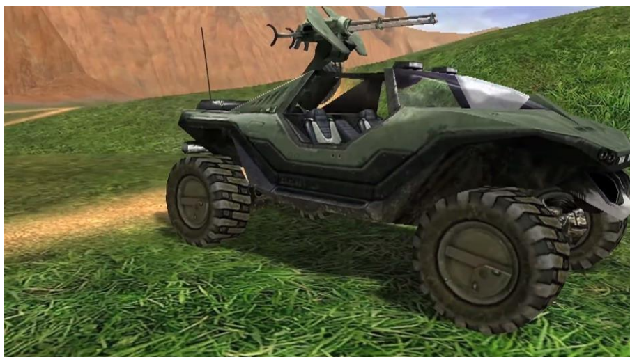
Figure 4 - L'apparition du véhicule Warthog dans le deuxième épisode de la série Red Vs. Blue

Pour illustrer la portée critique de cette resémantisation de la pratique vidéoludique, attardons-nous sur un extrait du deuxième épisode de la série 19 , dans lequel l'équipe des rouges reçoit un nouveau véhicule de combat portant le nom de « Warthog ». Dès l'arrivée du véhicule (01:09) 20 et durant tout le reste de l'épisode, celui-ci ne sera pas utilisé par les protagonistes mais deviendra l'objet de tous les regards. La mise en scène du Warthog y est très cinématographique : la « caméra » (qui, notons-le, est performée par un joueur) zoome sur ses attributs et tourne autour de l'engin pour le mettre en valeur comme s'il s'agissait d'une publicité (01:22). La fonction initiale du véhicule, à savoir le combat, passe ici à la trappe au profit d'une interminable discussion sur le choix de son nom. Or cette tergiversation fonctionne comme une totale négation de l'action, donc comme une subversion de la dimension militaire qui est pourtant centrale dans les jeux Halo . L'humour de l'épisode est presque intégralement construit sur ce simple transfert d'un élément depuis un contexte ludique où règne le combat vers un support non interactif (la vidéo), statique, et qui ne cesse de mettre en scène sa staticité (dans cet épisode comme dans bien d'autres, il ne se passe presque rien). Le dispositif produit ce que Genette (1982 : 532) décrit comme un « comique hypertextuel », à savoir un comique provenant essentiellement du fait que le machinima est subordonné à un hypotexte.