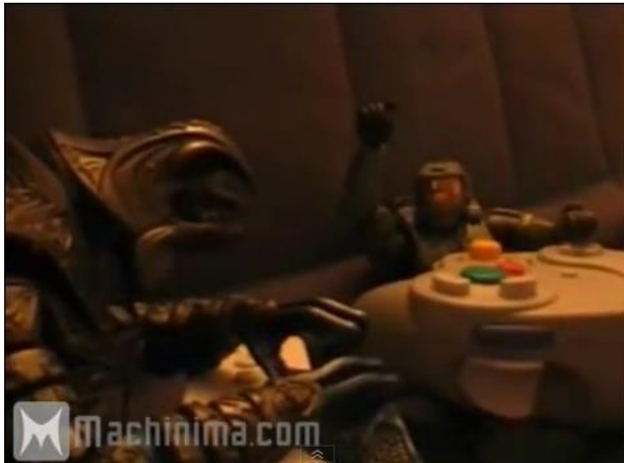
Figure 9 - Les deux protagonistes de la série Arby 'n' the Chief

La pratique ludique de ces deux personnages – qui incarnent respectivement les archétypes du « bon » et du « mauvais » joueur – permet à l’auteur de représenter de façon scénarisée des situations typiques du jeu multijoueurs et, par le biais de ce discours au second degré, de porter un regard critique sur la communauté des joueurs. Or plusieurs épisodes poussent le dispositif un degré plus loin en représentant les protagonistes, non plus en train de jouer, mais en train de créer eux-mêmes un machinima . Dans « The Movie » 27 , la figurine du Master Chief (archétype du joueur immature, vulgaire et mauvais perdant), regarde une vidéo du machinimaker Digitalph33r (auteur de la série) et estime que ce dernier ne produit que de mauvais films : il décide donc de réaliser lui-même un machinima . Quelques minutes de vidéo plus tard (08:30), il montre le résultat à ses compagnons, qui ne peuvent que s’effarer devant la médiocrité du film, celui-ci reproduisant les défauts majeurs des machinimas « bas de gamme » (un scénario caricatural, une caméra tressautante, de mauvais performers qui font bouger leurs avatars dans tous les sens pendant leurs répliques, etc.).