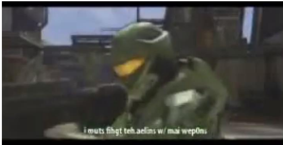
Figure 10 - Le personnage du Master Chief performant son rôle dans le machinima qu'il a lui-même produit et répliquant (dans un anglais « tchatté ») : « I must fight the aliens with my weapons, before it's too late ! »

Par cette mise en abyme, le détournement – et non le jeu – devient un motif narratif : ce n'est plus la pratique du jeu qui est représentée de manière ironique, mais bien celle du machinima ; et c'est avec ses codes que joue l'auteur. Ce dernier parvient ainsi à élaborer un véritable discours critique sur la pratique (il met au jour les défauts récurrents de certains machinimas ) et à le parodier d'un même geste en l'incluant dans une fiction (la série Arby 'n' the Chief , qui est déjà elle-même un discours au second degré). À travers ce « machinima dans le machinima », le détournement se détourne lui-même, exhibant devant le lecteur son propre mode de fonctionnement et sa propre genèse.