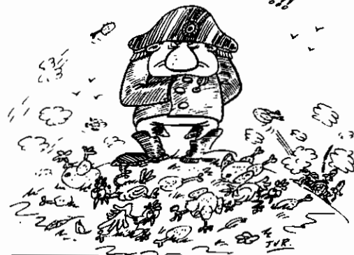
par Jacques Van Russell

WATERZOOI... WATERZOOI... MORNE PLAINE BALAYÉE PAR LE VENT DES POULETS DE CANONS !!!