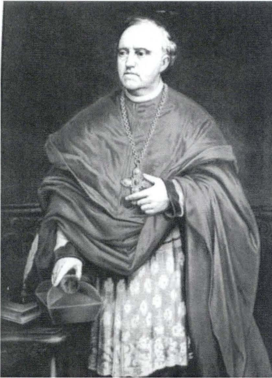
Le Cardinal Victor Auguste Dechamps (1810-1883)

Tableau 19 e s., Malines, Grand Séminaire.